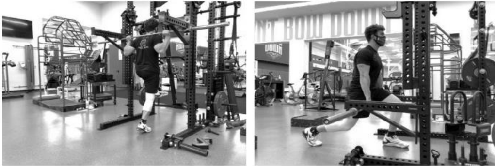
Fig (VII) 3: Contracción del tipo “Overcoming” o PIMA (11).

Otra diferencia entre ambos tipos de contracción es la capacidad de mantener el esfuerzo. Schaerer (15) realizó un estudio en el que, mientras uno de los participantes empujaba isométricamente (PIMA) intentando realizar una extensión de codo, el otro participante resistía la aplicación de esa fuerza (HIMA) evitando la flexión. Si el sujeto que realizaba abandonaba la tarea acompañada de una baja en la fuerza, se catalogaba la prueba como “Fallo PIMA”. En cambio, si el sujeto que resistía la fuerza, dejaba la contracción isométrica o abandonaba la prueba, se catalogaba como “Fallo HIMA”. En 34 de las 40 pruebas realizadas, el resultado fue “Fallo HIMA”.