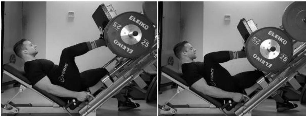
Fig (VII) 2: Fase inicial del “Quasi-isométrico” y su posición final luego de una contracción excéntrica máxima en un empuje a una pierna (10).

Dentro de este grupo también distinguimos las “Quasi-isométricas”, en este tipo de contracción se mantiene una posición hasta que la contracción isométrica falla y se resiste la subsecuente fase excéntrica.