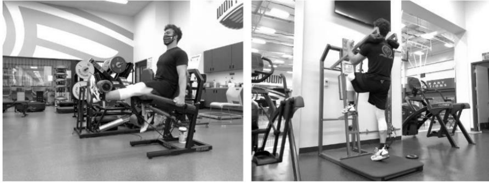
Fig. (VII) 1: Contracción del tipo “Yielding” o HIMA (11).

Dentro de este grupo también distinguimos las “Quasi-isométricas”, en este tipo de contracción se mantiene una posición hasta que la contracción isométrica falla y se resiste la subsecuente fase excéntrica.