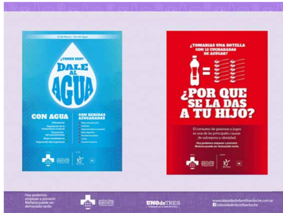
Figura 2 Mensajes Campaña “Dale al agua”