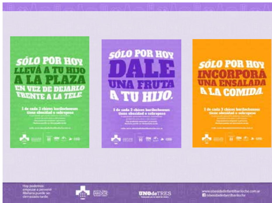
Figura 1 Mensajes Campaña “Solo por hoy”