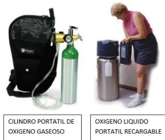
Fig.3: sistemas portátiles de oxígeno. 62

La segunda opción para proporcionar oxígeno ambulatorio tradicional es acoplar el LOX estacionario antes mencionado con un contenedor de LOX portátil más pequeño que el paciente puede rellenar antes de la deambulaci3n. Dado que el proveedor de atenci3n domiciliaria necesita recargar la unidad base estacionaria de LOX aproximadamente cada 10 a 14 d3as, se considera que esta opci3n portátil tradicional es m3s rentable para los pacientes que caminan mucho. 61,62