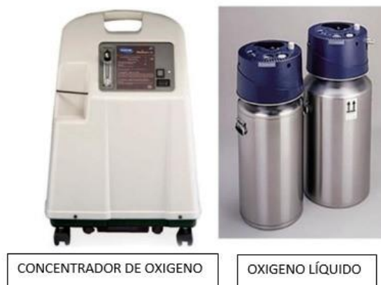
Fig.2: sistemas estacionarios de oxígeno. 62

El oxígeno en estado líquido puede ser almacenado, transportado y traspasado a otros dispositivos de manera más eficiente que los sistemas de gas. Pueden proporcionar hasta 15 L/min de oxígeno de flujo continuo. Se recomienda en pacientes que precisan oxígeno fuera del domicilio y flujos altos en reposo (más de 3 L/min). Sin embargo, como el contenido de oxígeno se agota, requiere recarga periódica por el proveedor de cuidados domiciliarios. 6,61