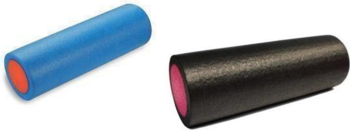
Fig. 13 y 14: Foam roller liso (41,42)