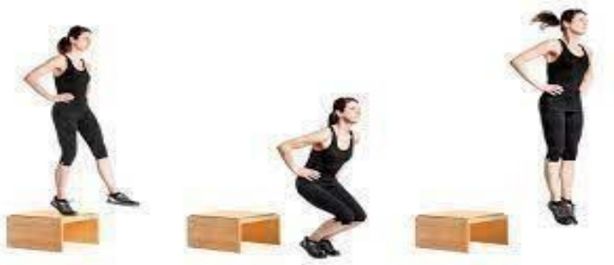
Fig. 8: Drop Jump (31).

reflejo miotático. Modificando la altura de caída se permitirá diferenciar la altura óptima de caída para obtener un mayor salto vertical. También se ha denominado como test de fuerza explosivo-reactivo-balística o explosivo-elástico-refleja (28).