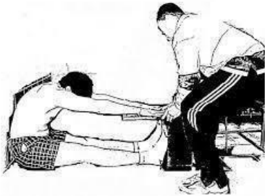
Fig. 1: Clásico sit-and-reach test (CSR) (21).