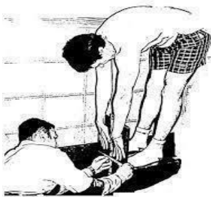
Fig. 5: Toe-touch test (TT) (21).

Todas las variaciones del SR implican un movimiento global de flexión de tronco, lo que se modifica es la posición del sujeto a evaluar (unilateral o bilateral, sedestación o bipedestación,