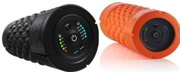
Fig. 15 y 16: foam roller vibratorio (43,44)