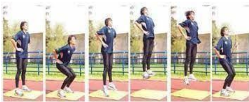
Fig. 7: Counter Movement Jump (30).

Se comienza de una extensión de rodillas en bipedestación, para luego realizar un movimiento rápido de flexo-extensión de las rodillas hasta un ángulo de 90°, para consecutivamente y sin pausa alguna efectuar un salto vertical máximo. Evalúa la fuerza explosiva con reutilización de energía elástica pero sin aprovechamiento del reflejo miotático. A este tipo de salto se lo puede denominar también como test de fuerza concéntrico-elástica-explosiva o test de fuerza explosivo-elástica (28).