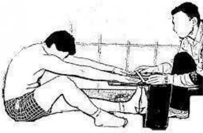
Fig. 3: Back-saver sit-and-reach test (BSSR) (21).

c) Back-saver sit-and-reach test (fig. 3):