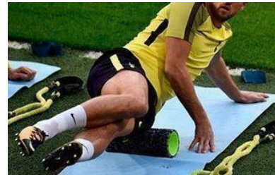
Fig. 9: Aplicación de FR en isquiotibiales (37).