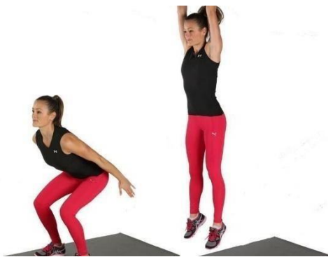
Fig. 6: Squat Jump (29).

elástica ni aprovechamiento del reflejo miotático. También se lo puede denominar como test de fuerza explosiva concéntrica o prueba de fuerza máxima dinámica (28).