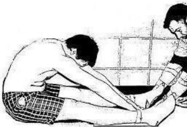
Fig. 2: V sit-and-reach test (VSR) (21).