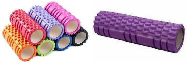
Fig. 11 y 12: foam roller multinivel y texturado (39,40)