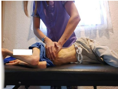
Fotografía autorizada por el tutor