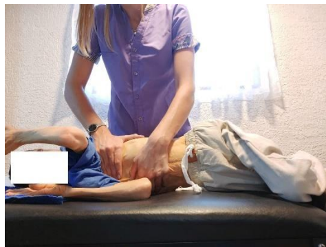
Fotografía autorizada por el tutor