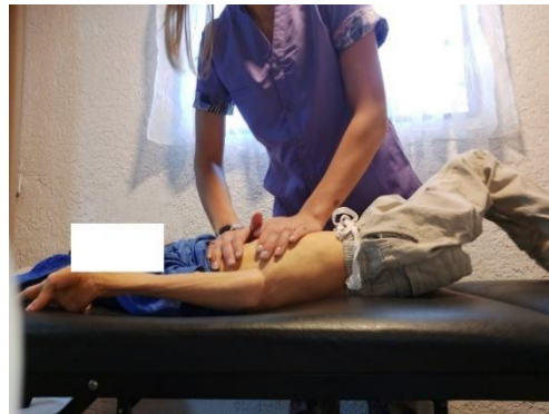
Fotografía autorizada por el tutor