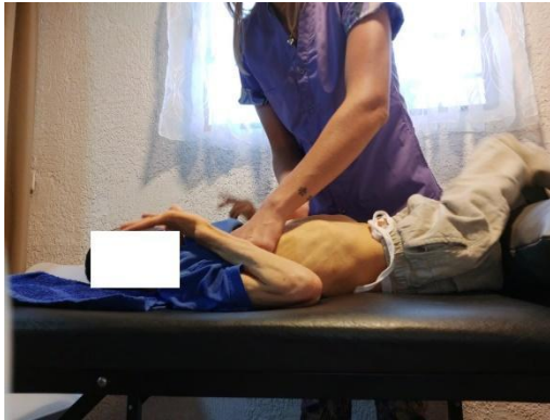
Fotografía autorizada por el tutor