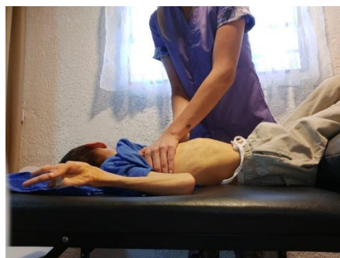
Fotografía autorizada por el tutor