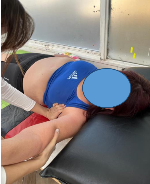
Inducción del dorsal ancho