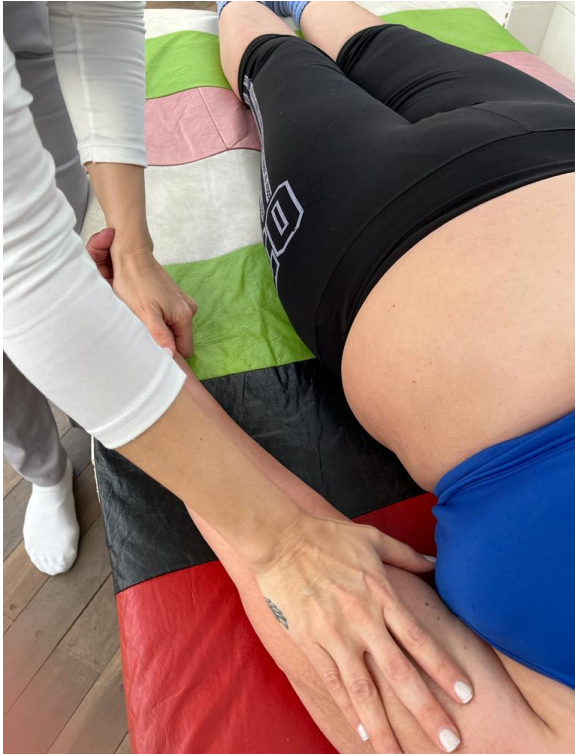
Técnica bíceps braquial