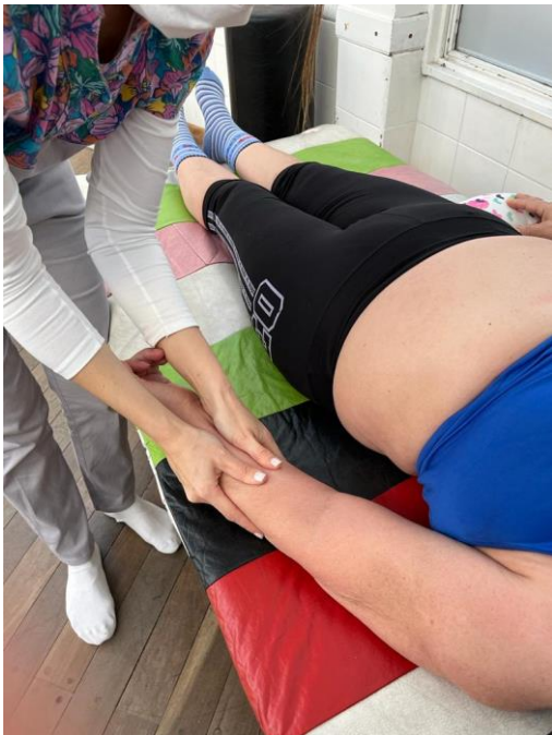
Técnica deslizamiento longitudinal de los flexores de muñeca.