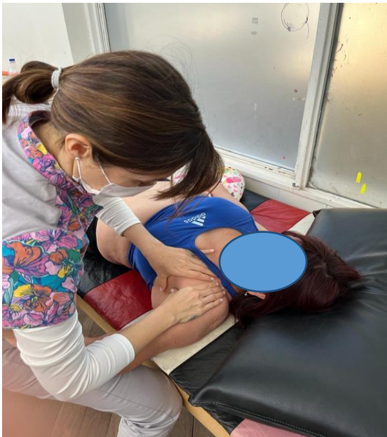
Inducción del pectoral mayor