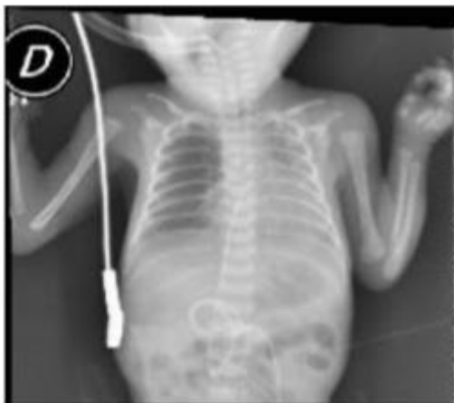
FIGURA 2 .Radiografía anteroposterior de tórax donde se observa la dilatación de asas intestinales tejido intestinal y aumento la cámara gástrica generando presión sobre el tórax.

derecho y desplazamiento del mediastino y del corazón hacia la derecha, además de condensación homogénea en el lóbulo medio e inferior derecho (Figura 1), con lo que se diagnosticó una atelectasia retrocardiaca sumado al aumento de la neumonía. Se interconsultó con el Servicio de kinesiología con el objetivo de plantear un tratamiento que lograra mejorar la inestabilidad hemodinámica de la paciente.