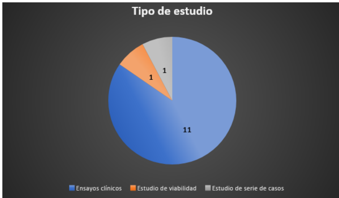
Gráfico N°1 – Tipo de estudio (Gráfico confeccionado por el autor)

Nos referimos a los tipos de estudios que forman parte del total de 13 artículos encontrados, de los cuales 11 (27), (28), (30), (31), (32), (33), (34), (36), (37), (38), (39) corresponden a ensayo clínico, 1 (29) es estudio piloto de serie de casos, y 1 (35) estudio de viabilidad. (Gráfico N°1)