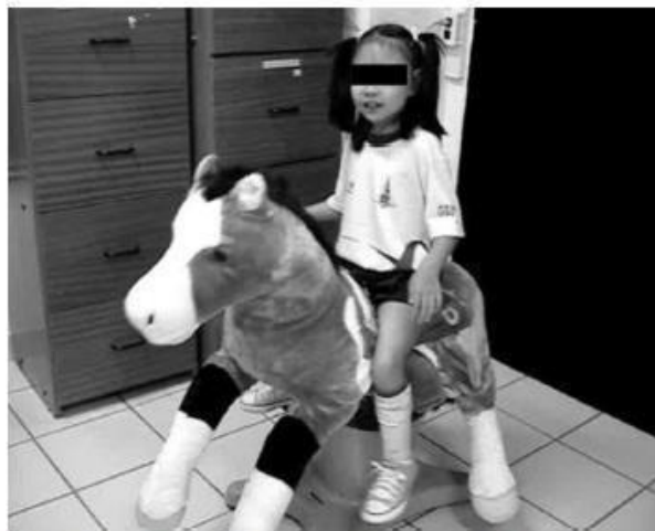
Fig 1. The riding simulator (Joba®) disguised as a velvet pony.

obstáculos, trabajar el equilibrio y coordinación, y poder obtener una mejoría en su base de sustentación. Dentro del mismo el profesional puede ir indicando órdenes claras para poder mejorar posturas o movimientos que se van ejecutando cuando el niño se mueve. También se trabaja con los distintos sentidos, sobre todo lo visual, auditivo y táctil. (11, 23)