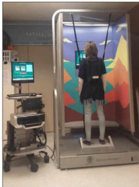
Imagen 1. Posturógrafo 41 .