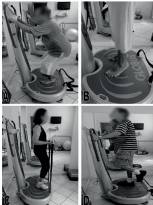
Imagen 2. Diversos ejercicios sobre la plataforma vibratoria 60 .

En cuanto a la amplitud, la mayoría de las plataformas permiten valores entre 2 y 10 mm; y con respecto al tiempo de aplicación, existe una gran variabilidad, aunque se concluye que el tiempo total de aplicación es de 4 a 20 min, distribuidos en varias series de pocos minutos o segundos (30seg-3min), intercalando descansos de 30 a 60 seg, realizándose con una periodicidad de entre 3 a 5 veces a la semana 58-59 .