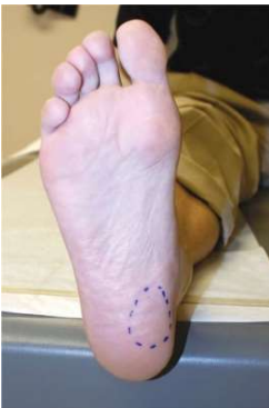
(Figura 2) Región medioplantar del talón donde se produce mayor dolor cuando se aplica presión durante el examen físico o al caminar en pacientes con FP. (2)

La prueba de Windlass presenta una alta especificidad (100 %) pero una baja sensibilidad (32 %) para la FP, lo que puede ser útil para confirmar la enfermedad durante la exploración física. (18)