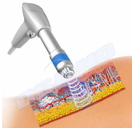
Figura 2: Transmisión de las ondas aplicadas

A nivel celular, se ha observado que estas ondas estimulan la liberación de trifosfato de adenosina (ATP), lo que activa diversas rutas de señalización y modula la función de canales iónicos ubicados en la membrana celular. Además, la formación y posterior colapso de microburbujas —producto de la microcavitación— favorece la liberación de óxido nítrico, un mediador clave asociado a respuestas analgésicas, angiogénicas y antiinflamatorias.