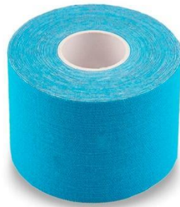
Figura 3: Kinesiotape

Las propiedades adhesivas y elásticas del KT pueden aumentar el espacio entre tejidos y, por lo tanto, facilitar la circulación sanguínea y el drenaje linfático. Aumenta la flexibilidad muscular, proporciona un buen soporte musculoesquelético y promueve el rendimiento motor. También alivia el dolor y promueve la facilitación neuromuscular proporcionando estímulos continuos a los mecanorreceptores de la piel. Por tanto, son eficaces para prevenir y manejar lesiones deportivas, corrección de trayectorias de movimiento, estabilizar las articulaciones y mejorar el rendimiento muscular. (23)