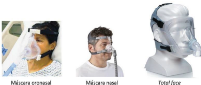
Imagen 1: Interfaces que se utilizan en VNI. Ferrero G. Ventilación no invasiva: modalidades y equipos. Rev Chil Enf Respir. 2008;24(3):240–50 36 .

“Efectos de Ventilación No Invasiva sobre la función pulmonar, calidad de sueño y calidad de vida relacionada con la salud, en pacientes con EPOC con apnea obstructiva del sueño”.