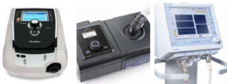
Imagen 2: Dispositivos que se utilizan en VNI. Ferrero G. Ventilación no invasiva: modalidades y equipos. Rev Chil Enf Respir. 2008;24(3):240–50 36 .