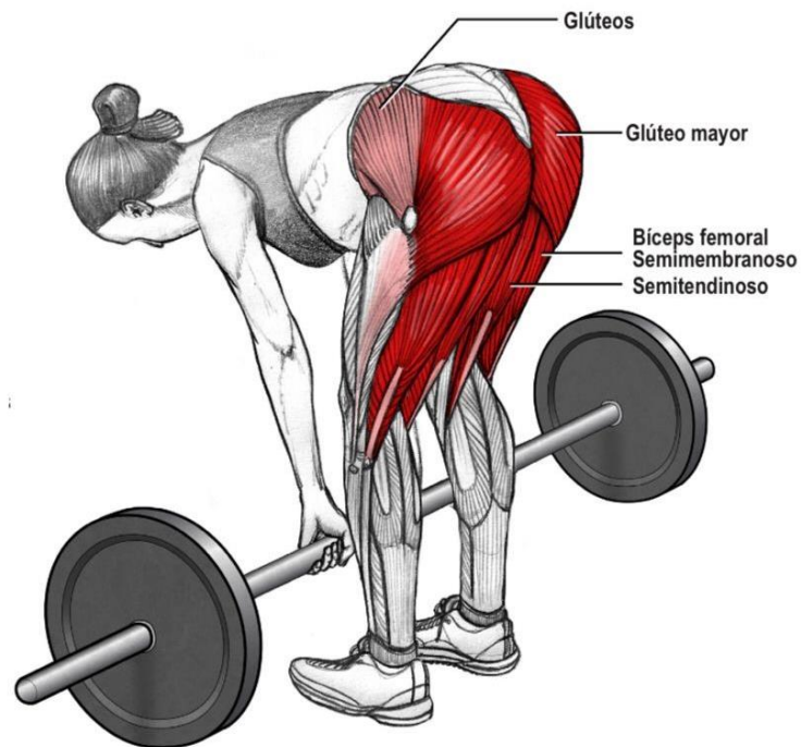
Imagen 3. Fuerza. Entrenamiento. Anatomía: análisis e integración de conceptos / Jerónimo Milo.- 1a ed . Ciudad Autónoma de Buenos Aires: JMILO Ediciones, 2020. Libro digital