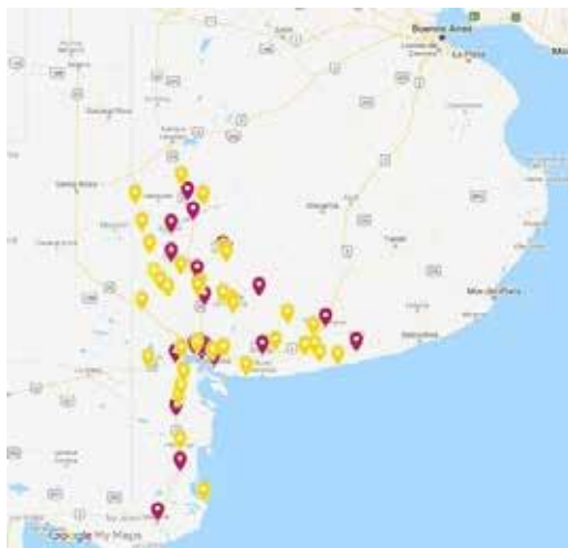
Mapa 1: Puntos de atención de PAMI. En color bordó se observan los puntos de atención institucional; en color amarillo, los puntos de atención de PAMI en el Barrio.