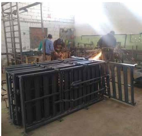
Imagen 1: Internos de la Unidad Penitenciaria Local Nro. 4 trabajan en la reparación de camas ortopédicas