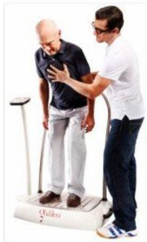
IMAGEN 1: Plataforma vibratoria de cuerpo entero.

Los equipos de WBV permiten trabajar cualquier parte del cuerpo, precisando en ocasiones la ayuda de arneses en el tratamiento de pacientes con trastornos graves del equilibrio, con apoyos uni o bipodal, con o sin carga según se quiera mejorar o no la capacidad aeróbica. Hay dos tipos principales de plataformas vibratorias: asincrónicas (verticales) y triplanares o basculantes (horizontal). En la primera, la vibración se produce en dirección predominantemente vertical, de forma sincrónica a lo largo de toda la base oscilante. En la triplanar, la vibración se produce a través de un eje de rotación central, lo que hace que los lados derecho e izquierdo se alternan horizontalmente como un balancín. En las plataformas verticales asincrónicas se pueden obtener buenos resultados en el fortalecimiento muscular, con menor riesgo de lesiones. Por su parte, en las triplanares, el ritmo de las vibraciones varía estocásticamente, ofreciendo resultados satisfactorios en la mejora de la propiocepción, al provocar sucesivas y múltiples situaciones de inestabilidad que fomentan el proceso de aprendizaje motor. (17) (47) (48) (49)