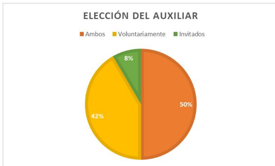
Gráfico 2. Elección de los auxiliares por parte de los docentes.

De las respuestas obtenidas previamente se evidencia que los docentes intentan dirigir su elección a los alumnos que se encuentran mejor preparados en la cátedra. Surgen invitaciones puntuales en algunas cátedras, primando la evaluación que los alumnos tuvieron durante su cursado y en caso de que los alumnos invitados no estén interesados optan por la colaboración voluntaria. Xantis y colaboradores 29 mencionan que los ayudantes alumnos eligen voluntariamente cumplir este rol como una forma de acercarse al ámbito académico, que les permite, acceder, aprehender, comprender y aplicar conocimientos relacionados con el desempeño del rol docente a partir de la