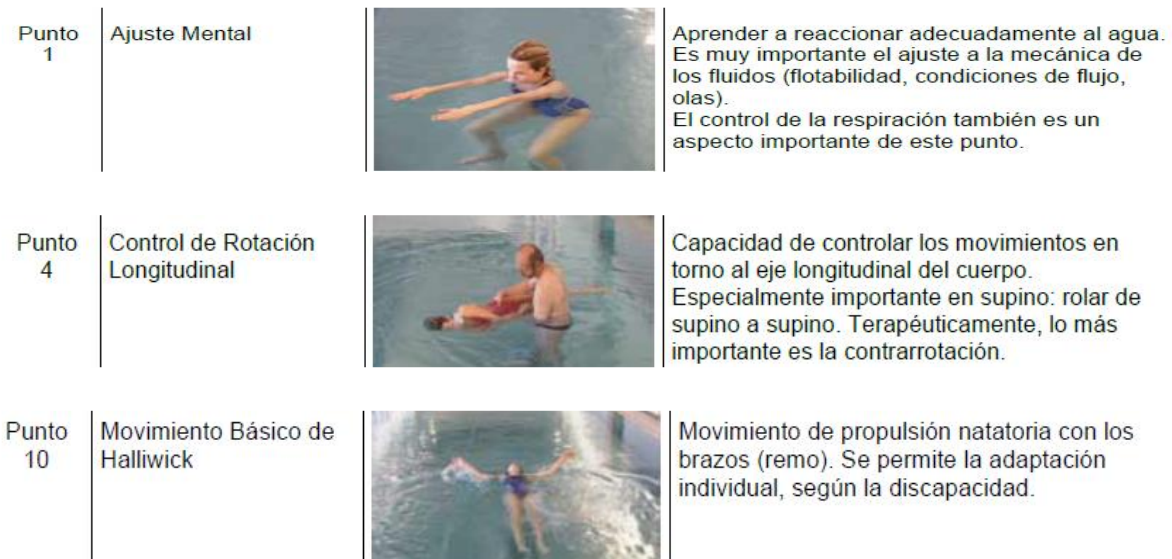
Gráfico 2: puntos 1,4 y 10 del Concepto Halliwick. (26)

Según su creador, la terapia debe enfatizar en las habilidades de la persona y no en sus dificultades, se espera también, que se genere una actividad placentera. El concepto puede ser utilizado para la adaptación al medio acuático, enseñanza de natación o rehabilitación y no es obligatorio realizar la secuencia de todos los puntos. (27,28)