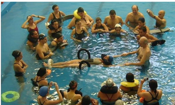
Grafico 3 : Método Bad Ragaz (31)

Hidrocinesterapia: este término es utilizado por los profesionales de la rehabilitación para nombrar el uso del ambiente acuático, como un recurso terapéutico auxiliar en el tratamiento de afecciones neuromotoras, músculo-esqueléticas, reumáticas o cardiorrespiratorias. Es considerada la base para todas las modalidades de terapia