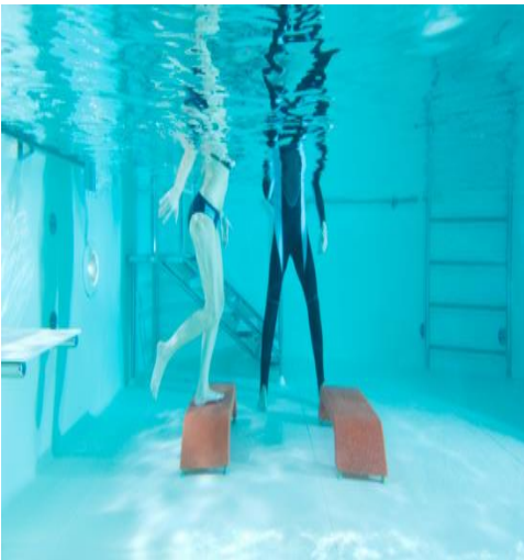
Gráfico 4: fortalecimiento de MMII con uso de step.

Es de vital importancia que el kinesiólogo tenga en claro los principios físicos del agua al momento de planificar el abordaje y sus ejercicios. Es potestad de éste, la adecuada elección, con creatividad y conocimiento, del camino a seguir dependiendo el paciente que se trate. También, dispone de una gran variedad de accesorios como: flotadores (cinturón, tobillera, muñequera, mancuernas, etc.) pelotas, steps y bandas elásticas. Con ellos, se podrá generar resistencia o facilitación al movimiento, flotabilidad, inestabilidad o desequilibrios. (32)